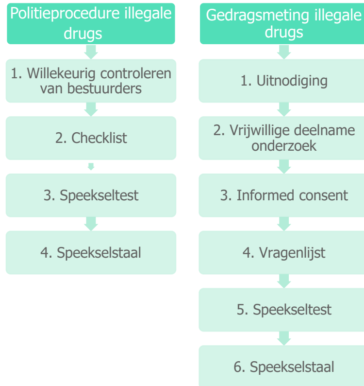
Figuur 1. Van de politieprocedure naar de gedragsmeting illegale drugs

onderging slechts één deelnemer een volledige drugscontrole door de politie, terwijl er door de politie bij de 266 gecontroleerde bestuurders vijf positieve checklists werden afgenomen (met drie positieve speekseltesten tot gevolg). Dat legt de participatiegraad van positieve bestuurders voor deze studie op 20%, daar ze allen werden uitgenodigd voor deze studie. Onze pilotstudie biedt bovendien enkele eerste inzichten in de validiteit van de huidige politieprocedure voor het controleren op ROID: een aantal bestuurders glipten door de mazen van het net en was niet positief bij de politie maar bleek wel positief te zijn op speekselniveau in onze pilotstudie.